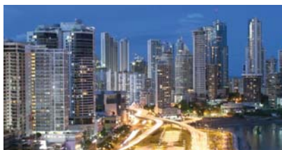
Panama City.